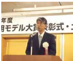
【国土交通省 横山不動産市場整備課長の来賓挨拶】