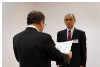
【黒川会長から受賞者へ賞状の授与】