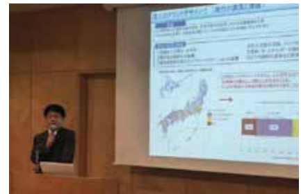
会場でのご発表の様子