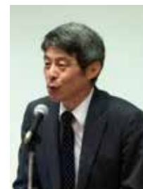
【清水街路交通施設課長】