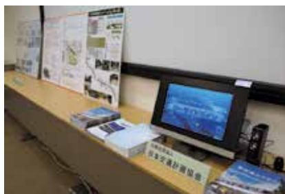
8階展示 映像およびパネル展示

<8階>北海道北見市／石川県七尾市／山形県朝日町／静岡県清水町／福井県越前市／ 福岡県新宮町／北海道下川町／新潟県十日町市／愛知県碧南市／ 独立行政法人都市再生機構／公益社団法人日本交通計画協会