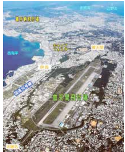
図3. 普天間飛行場の現況

以上の検討成果にもとづき、計画内容の具体化に向けた、今後の取組と手順をまとめている。