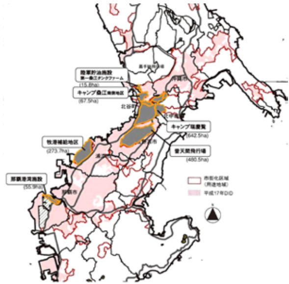
図1. 返還予定地の位置

沖縄21世紀ビジョン基本計画(平成24年5月)や前述の「中南部都市圏駐留軍用地跡地利用広域構想」を踏まえ、現段階で推定される跡地の現況にもとづく中間段階の計画であること、また、今後、立ち入り調査による計画条件の明確化、用地需要見通し等を反映し、計画を更新していくこと等、を前提としたものとしている。