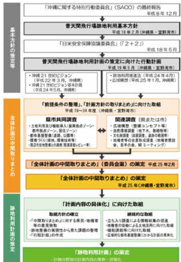
図2. 普天間飛行場跡地利用計画策定までの流れ